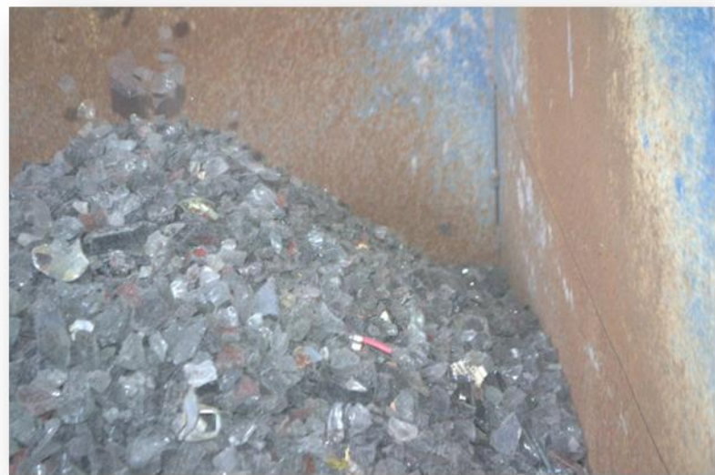
Materiał do ponownej segregacji