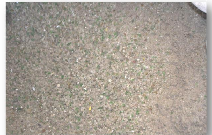
Surowiec od 0,1 do 2mm