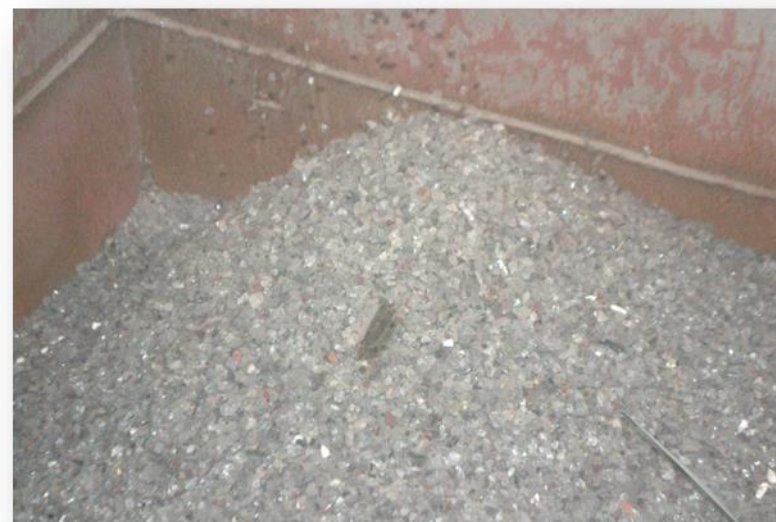
Surowiec od 2 do 16 mm